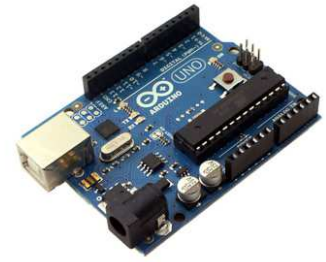
Placa UNO de Arduino

El workshop es divideix en quatre etapes, una primera d'introducció, una segona on els participants provaran els sensors i actuadors, una tercera un l'alumne proposarà una petita idea per fer amb Arduino i la darrera part on es documentaran on-line els projectes i es demostraran les possibilitats més avançades de la plataforma Arduino amb l'objectiu que els alumnes puguin seguir desenvolupament els seus propis projectes a casa.