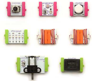
Mòduls de littleBits

Els littleBits s'uneixen amb imans, de manera que els nens podran dur a terme les seves creacions en un entorn segur i intuïtiu.