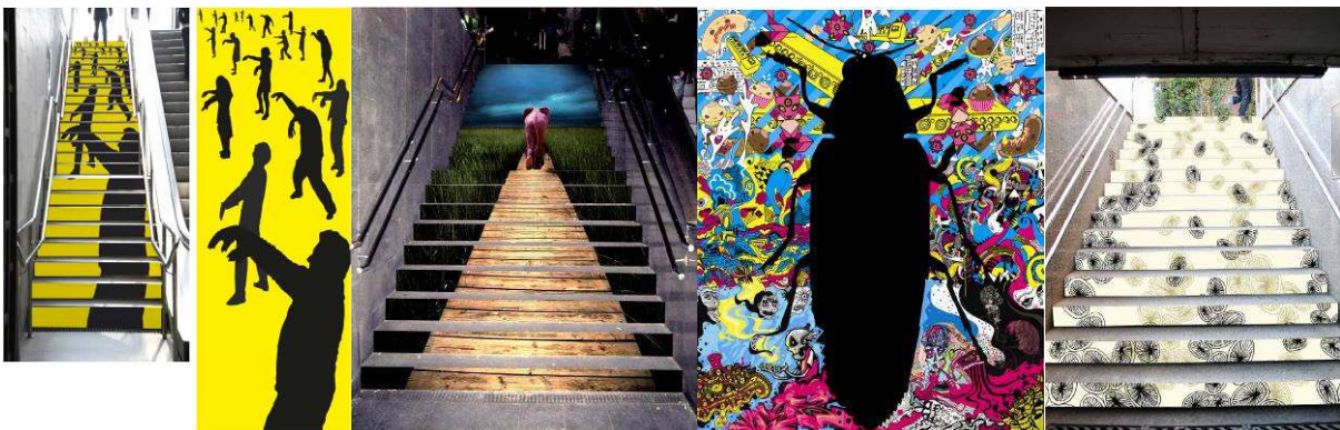
Reproduccions de "Citizen Zombie", "Cucarachart", "Follow me" i "Amebes", per aquest ordre.